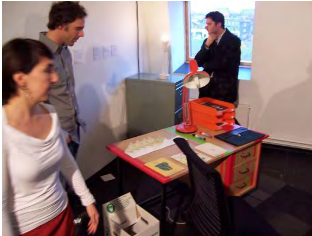
Exposition d'objets relookés par la Cité du Réemploi, NPDC