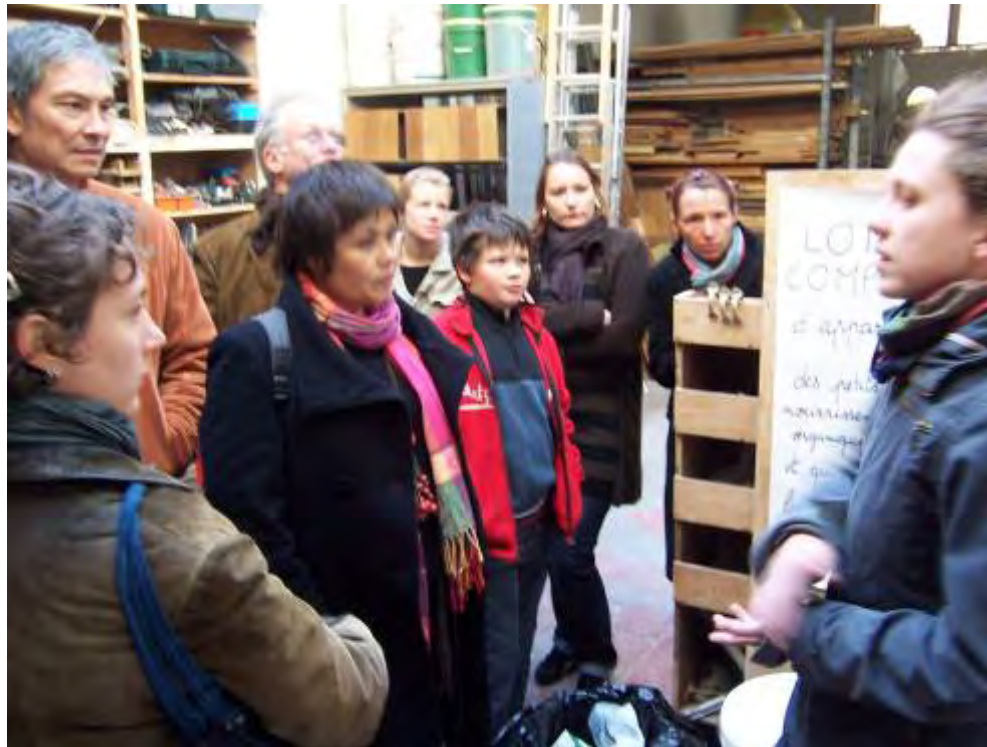
Lombricompost au Recyclodrome, PACA