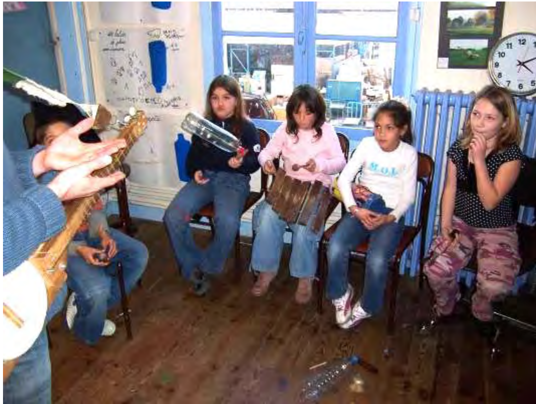
Musique et instruments de Récup' aux Ateliers de la Bergerette, Picardie