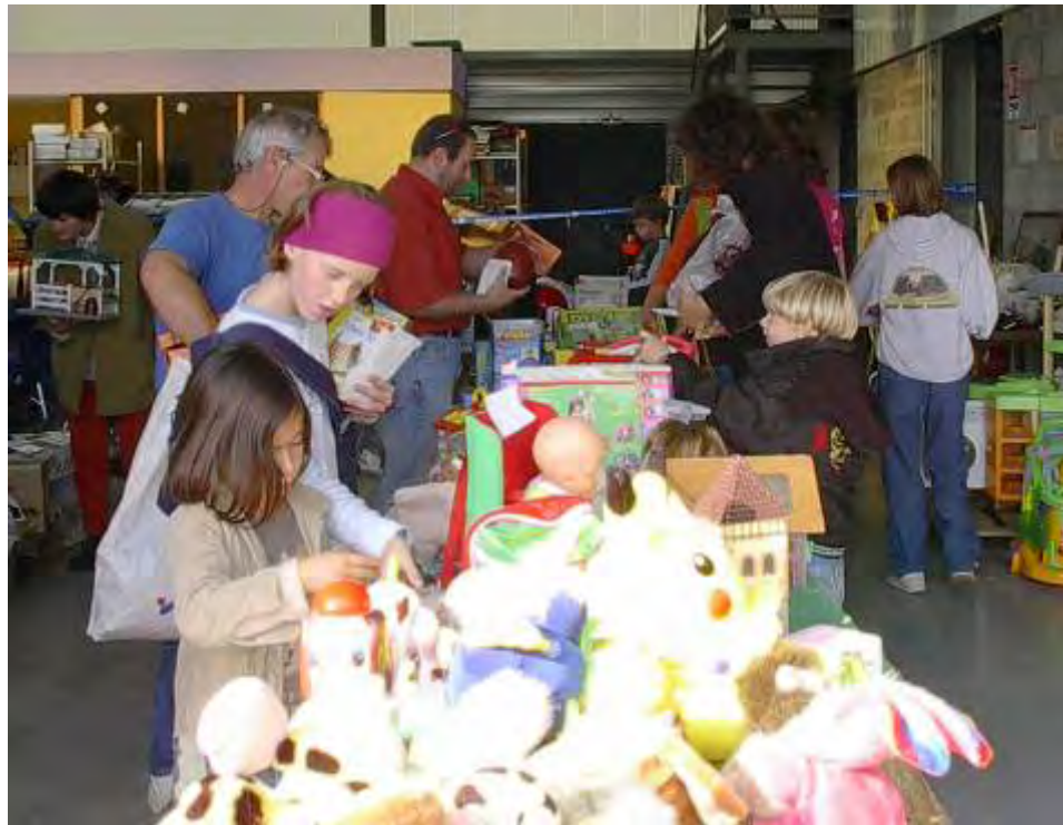
Utilo'Troc à l'association T.R.I. , Franche Comté