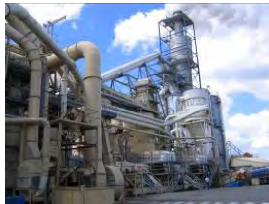
Krono France, vue extérieure de l'usine