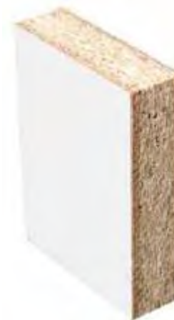
Panneau de particules