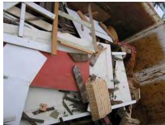
Contenu caisson bois déchèterie