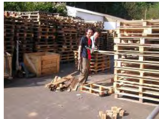
Préparation des palettes avant réparation