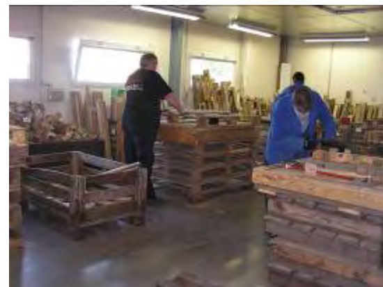
Atelier de réparation des palettes